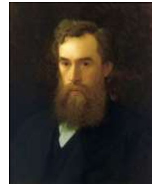
Д. П.М. Третьяков.

17. Этот человек легко и щедро расходовал свои средства на меценатство. Его «Абрамцевский кружок» был знаменит и стал центром художественной жизни России. Знаменитые художники создавали здесь свои работы: Е.Д. и В.Д. Поленовы, В.М. и А.М. Васнецовы, И.С. Репин, В.А. Серов, К.А. Коровин, М.А. Врубель, И.И. Левитан. Деятельность этого объединения положила начало русскому модерну в архитектуре, возродила русские народные ремесла, резьбу по дереву, изразцы, вышивки; способствовала собиранию коллекции произведений народного искусства. Именно ему принадлежит идея Московской частной оперы в Москве, где расцвели таланты певцов, композиторов, режиссеров Ф.И. Шаляпина, Н.И. Забелы-Врубель, С.В. Рахманинова.