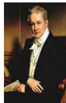
В) А. ГУМБОЛЬДТ