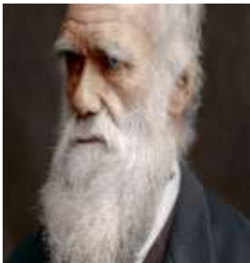
А). Ч. Дарвин