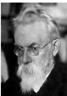
А) В.И. ВЕРНАДСКИЙ