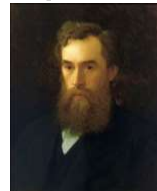
Д. П.М. Третьяков.

17. Этот человек легко и щедро расходовал свои средства на меценатство. Его «Абрамцевский кружок» был знаменит и стал центром художественной жизни России. Знаменитые художники создавали здесь свои работы: Е.Д. и В.Д. Поленовы, В.М. и А.М. Васнецовы, И.С. Репин, В.А. Серов, К.А. Коровин, М.А. Врубель, И.И. Левитан. Деятельность этого объединения положила начало русскому модерну в архитектуре, возродила русские народные ремесла, резьбу по дереву, изразцы, вышивки; способствовала собиранию коллекции произведений народного искусства. Именно ему принадлежит идея Московской частной оперы в Москве, где расцвели таланты певцов, композиторов, режиссеров Ф.И. Шаляпина, Н.И. Забелы-Врубель, С.В. Рахманинова.