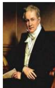
В) А. Гумбольдт