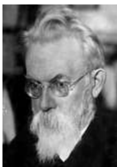
А) В.И. ВЕРНАДСКИЙ