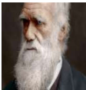
А). Ч. Дарвин