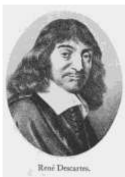
Б). Р. ДЕКАРТ