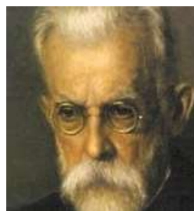
В) В. И. ВЕРНАДСКИЙ